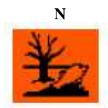
Peligroso para el Medio ambiente